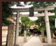
住吉神社 氏神様に参拝 ご祈禱

申込期間 2022年9月30日(金)～10月17日(月)必着。メールやFAX等でお申し込みください（裏面に申込書）