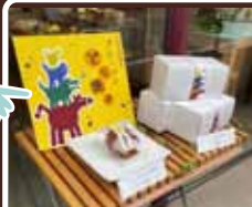
音楽隊を探せ ゲーム