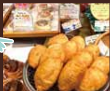
商店街めぐり ガイドとスポット、 お店を巡る