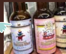
試飲・試食会 オリジナルビール と焼き鳥など

※このゲームにご参加するためには、商店街ポイントカード「プレカ」の利用登録が必要になります